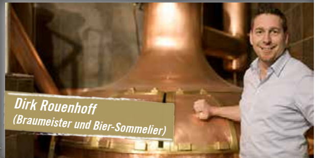
Dirk Rouenhoff (Braumeister und Bier-Sommelier)

Ab 19 Uhr unterhalten JimButton's unsere Gäste musikalisch. Aufgrund der hohen Nachfrage ist es empfehlenswert, vorab einen Tisch zu reservieren: (0211) 82 89 55 0